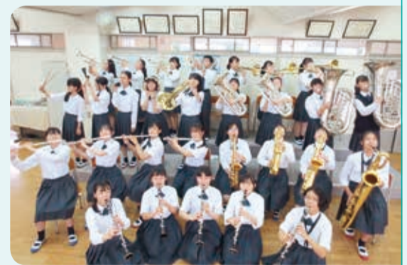
横浜市立南瀬谷中学校 吹奏楽部

昨年は、新型コロナウイルス感染症の影響で、部活動が十分にできませんでした。しかし、休校期間中でも全員が楽器を持ち帰って自宅で練習をしたり、それぞれの練習動画を組み合わせて遠隔で合奏をしたりして、諦めずに練習を続けました。 その結果、2部門3チームが全国大会に出場でき、いずれも銀賞を頂くことができました。これからも私たちのモットーである「音返し」を大切に、周りの方々に感謝の気持ちを伝えていきたいです。