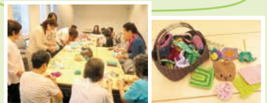
アクリルたわし作り

地球温暖化対策の講座や洗剤がいらぬ「アクリルたわし」などを手作りして地域で配布するなど、環境に配慮した消費生活の啓発にも取り組んでいます。