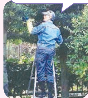
男のボランティア となり組

退職後何をしようか悩んでいましたが、庭木の剪定など、地域の人の生活をサポートする活動をしている中で、新しい仲間も増えました!自身の健康増進にもなっています!