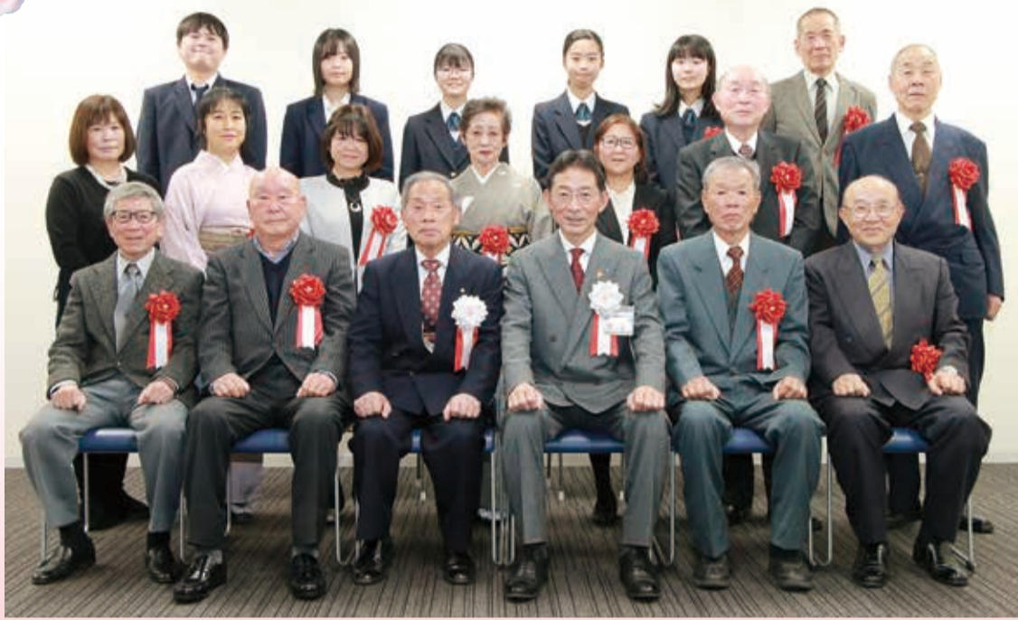
※撮影時にマスクを外しました。

区民に夢と希望を与え、元気づけてくれる活動をしている人に光を当て、その功績をたたえる「瀬谷区生き生き区民顕彰」制度。福祉、保健、環境保全、街づくり、自治会町内会運営、文化、スポーツ、学術、防犯・防災、その他の分野において、功績のあった皆さんを一月に区長から顕彰しました。