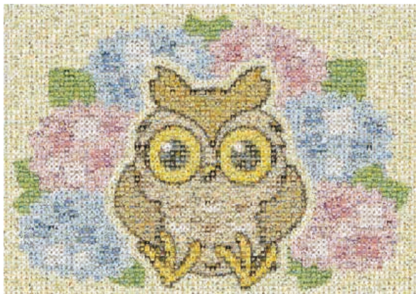
作品は3種類あります!