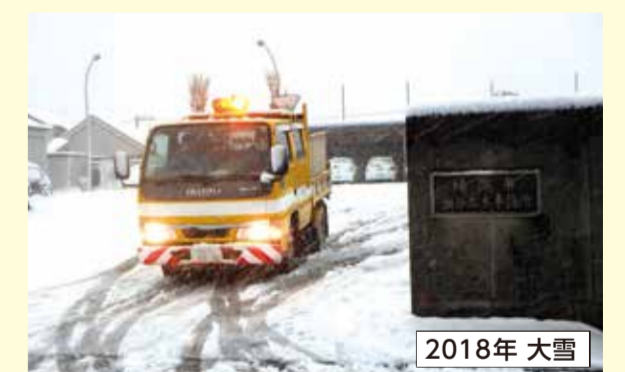
2018年大雪 区内の除雪作業のため、出勤しました。