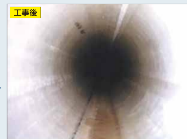
下水管の内面を補修することで、管をよみがえらせます。