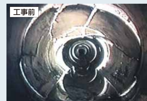
老朽化した下水道管