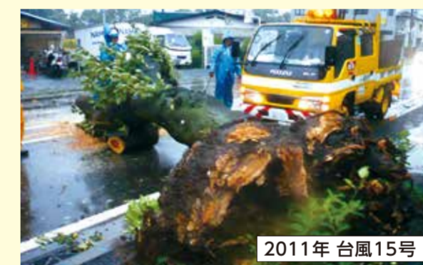
2011年台風15号 道路をふさぎ、交通の妨げになっていた倒木を撤去しました。