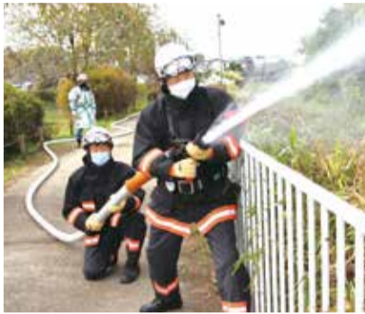
放水活動も基本を学んで安全確実に!

私たちと一緒に、瀬谷のまちを守っていきませんか。まずは、お気軽にご連絡ください。