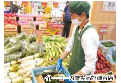
イトーヨーカ堂食品館瀬谷店