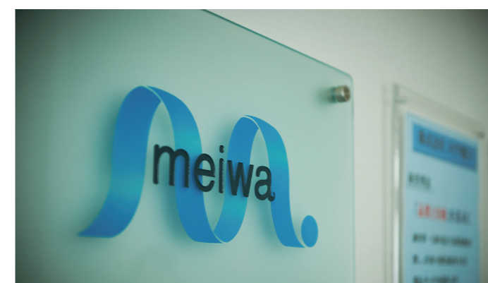
ご来社お待ちしております。