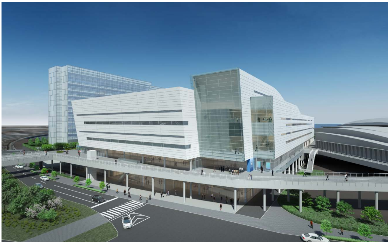
国際大通りよりMICE施設を望む