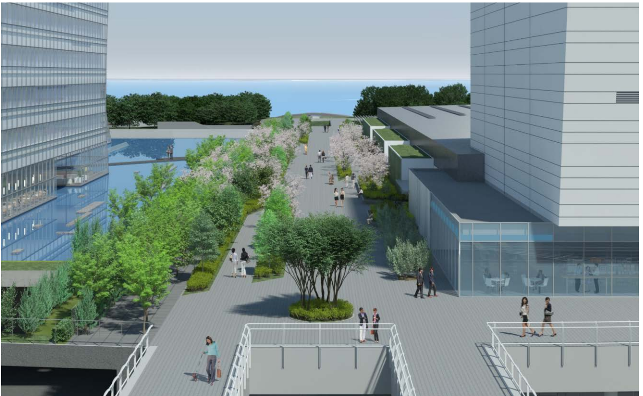
キング軸（近景より臨港パーク方面を望む）

※図面は提案資料として提出されたものであり、実際の建物とは異なる場合があります。