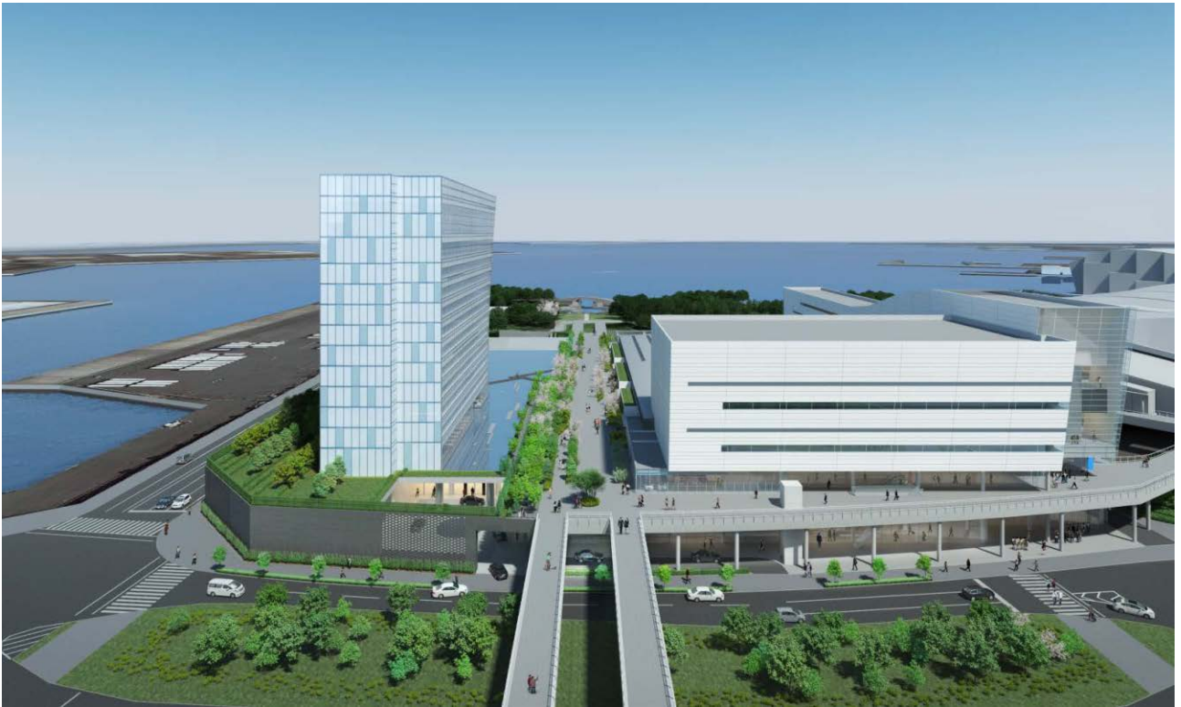
キング軸上空より臨港パーク方面を望む