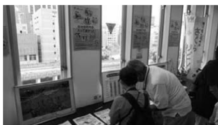
子どもアドベンチャーでのPR