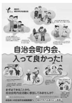
加入促進ポスター