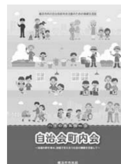
情報交流誌 vol.5 (29年度発行)

自治会町内会相互の情報共有を図るため、加入促進や活性化の先進的な事例を掲載する「ハマの元気印 自治会町内会情報交流誌」を発行 (3月予定)