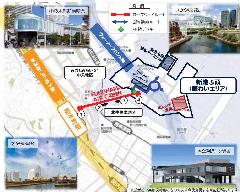
図3 ネットワーク概略図