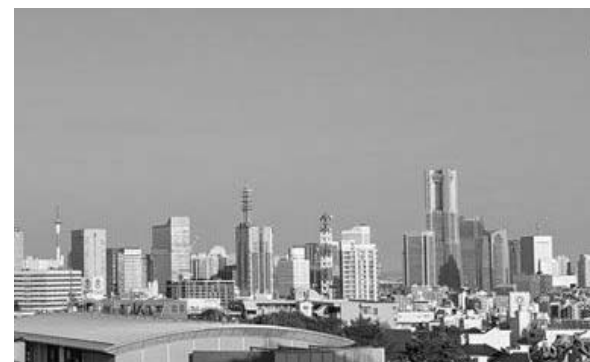
7階有料個室からの眺望（一例）