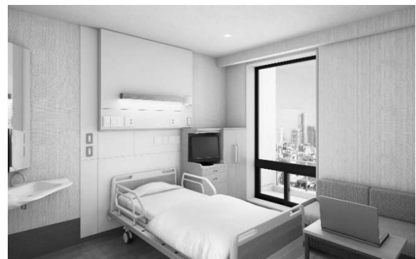
個室B（シャワー・トイレ付き）