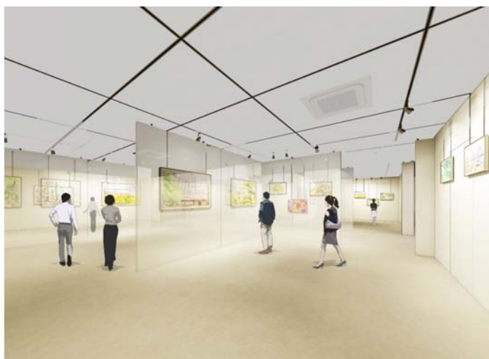
瀬谷区民文化センター ギャラリー(3階)