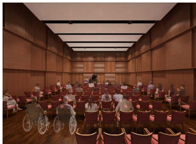
瀬谷区民文化センター 音楽多目的室(4階)