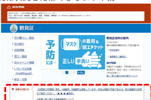
【参考】区ホームページのトップページ（イメージ）