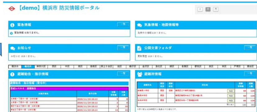
【参考】横浜市防災情報ポータル（デモ）