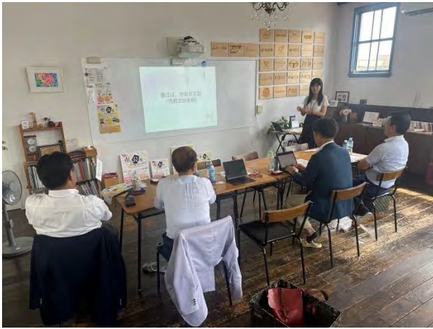
(H a n a 道場にて説明聴取及び質疑)