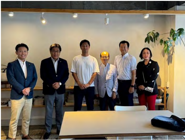
(福井県まちづくりセンターにて)