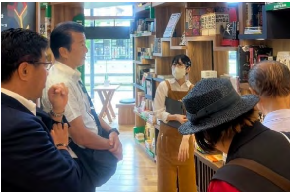
(ちえなみきのブックスペースにて)