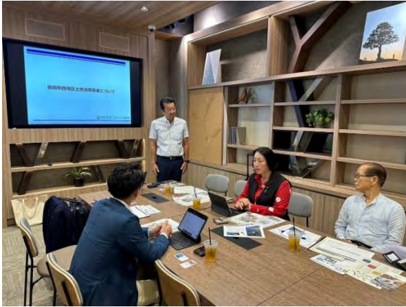
(ちえなみきのフリースペースにて)