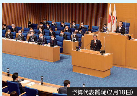
予算代表質疑(2月18日)

令和4年第1回市会定例会が、1月31日から3月23日まで開催されました。今定例会では、以下の2件を含む6件の議員提出議案が可決されました。