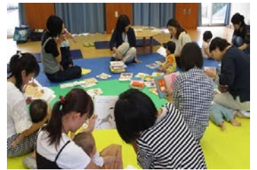
0歳からの絵本に親しむ講座