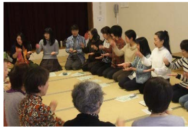
読み聞かせボランティア向け わらべうた講座