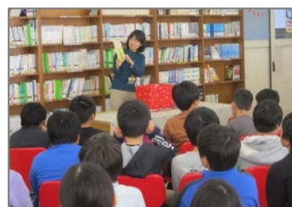
児童向けブックトーク