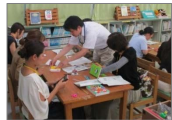
学校図書館ボランティア向け 図書修理講座