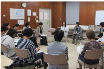
戸塚図書館おはなしボランティア懇談会