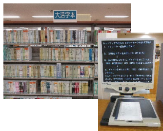
戸塚図書館で所蔵している 大きな活字の本や拡大読書器