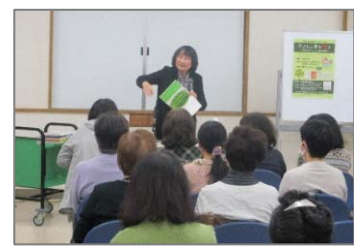
読み聞かせボランティア ステップアップ講座