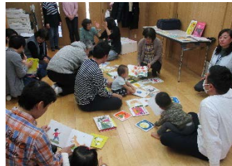
パパ向け絵本講座