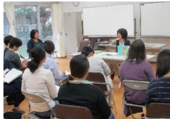
学校図書館ボランティア向け 読み聞かせ講座