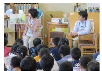
児童向け読み聞かせ講座