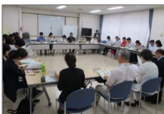
戸塚区読書活動推進懇談会