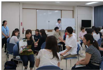
保育士向け絵本の読み聞かせ研修