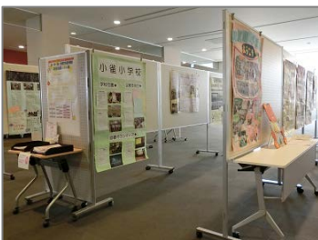
小・中・高・特別支援学校 読書活動パネル展