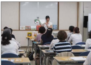
読み聞かせ活動入門講座