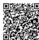
とつか読書マップ