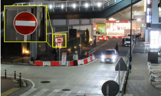
一方通行化により、 国道1号側より進入不可 としました。