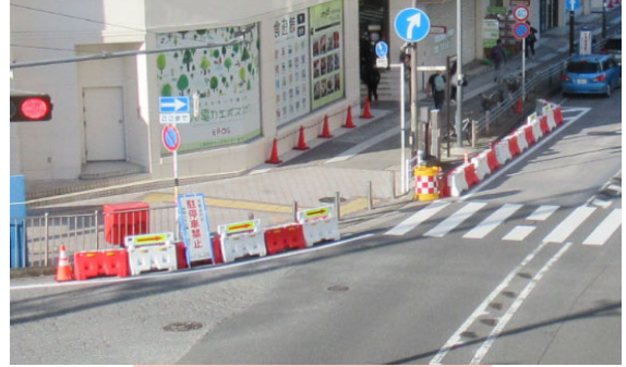
仮設防護柵を設置し、 駐停車禁止エリアを明確化 しました。