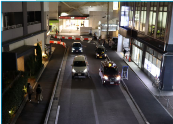
対向車両が無くなり、 安全に通行できる ようになりました。