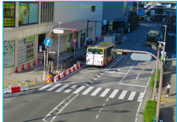
対向車線への はみ出し走行が少なくなり ました。