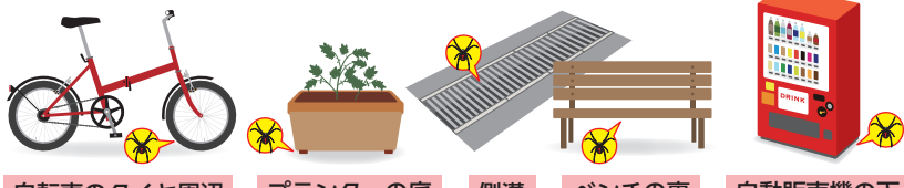
自転車のタイヤ周辺 プランターの底 側溝 ベンチの裏 自動販売機の下

日当たりの良い暖かい場所で、地面や人工物のくぼみ・穴・裏側など 身近なところに巣をつくります。