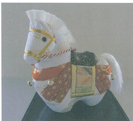
自主事業作品 木目込みの干支