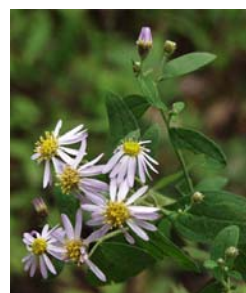
嫁菜 よめな 9月ごろになるとこんなかわいいお花が咲きます。