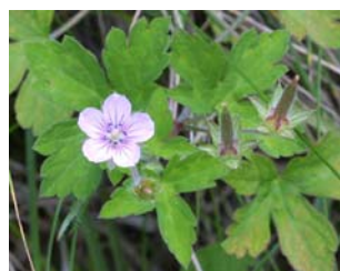
9月ごろの開花の状態