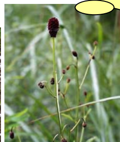
8月ごろの状態 吾木香 われもこう