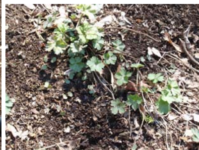
現の証拠 げんのしょう