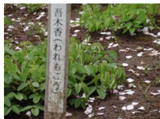
4月中頃の状態 緑が綺麗に茂って宿根草ら しく地面に根付くように！