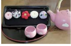
ころんとかわいらしいデザインです

①和の布あそび「和菓子を作ろう」 2月9日(水)・10日(木)〈全2回〉13時～15時30分 ☎成人 先10人 ¥1,000円 持裁縫道具 申1月12日10時から ☎