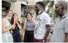
さまざまな国の留学生と交流できます!

①2022年4月入居者を募集します 応募資格や必要書類等の詳しい内容は、横浜市国際学生会館のHPをご覧ください。留学生以外に、レジデントアシスタント(日本人または永住者資格を持つ学生)も若干名募集します 市内の大学・短期大学・専修学校に在籍し、「留学」の在留資格のある人 申1月4日～28日17時(必着)までに必要書類を ☎か ☎