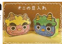
豆まきに使ってね

①オニの豆入れ▶めりえを貼って豆入れを完成させよう。1月29日(土)～30日(日)10時～16時 ②中学生以下先工作のみ各20人 ③窓