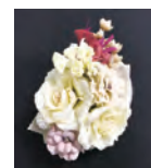
布製の花で作るコサージュ

①晴れの日を彩る手作りコサージュ ㊟9月3日(火)10時～12時 ㊠成人 ㊡10人 ㊢2,000円 ㊣8月13日10時から ㊤ (☎は14時から) ②転倒予防椅子体操▶椅子を使った簡単な運動 ㊟9月14日・28日、10月12日・26日、11月2日の土曜日(全5回)13時10分～14時 ㊠成人 ㊡16人 ㊢1,500円 ㊣8月17日10時から ㊤(☎は14時から)