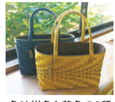
色は紺色と茶色の2種類から選べます