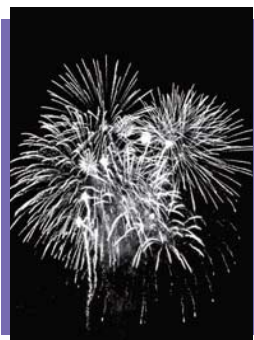
夏の夜空を彩る花火

区民の“ふるさと意識”を醸成するとともに、住民相互の連帯と親睦を深めることを目的に開催しました。