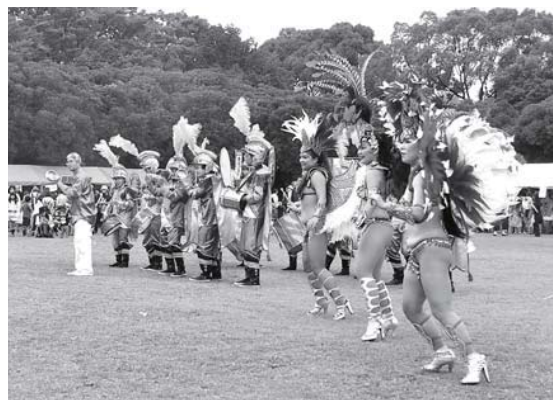
団体によるステージイベント(サンパシヨ)

ステージでは、地元団体による器楽演奏やダンス等が披露され、出店ブースでは、大分県佐伯市鶴見から「寿司トラック」がやってきました。また、沖縄の食と文化を体験できるリトルおきなわゾーンや、移動動物園によるポニー乗馬体験、動物とのふれあいコーナーが設けられ、会場は大いに賑わいました。