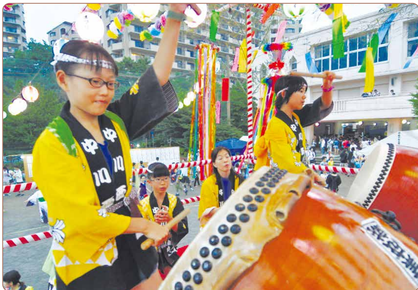
中川西ワイワイまつりの様子