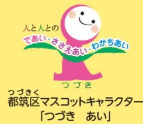
つづき つづきく 都筑区マスコットキャラクター 「つづき あい」