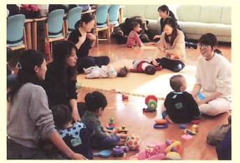
雨の日も遊べるね！

■都筑センター 子育ての情報交換、楽しく育児を！ 1階ふれあいルームで開催中！親子で楽しく過ごしながら、ママ同士の交流の場にもなっています。子育て支援グループあっぷりけのボランティアの皆さんが運営しています。 「子育てサロン」水曜日 10:00～12:00 TEL 045-941-8380