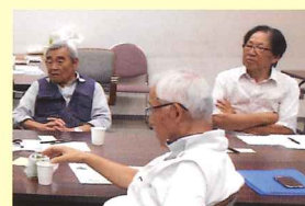
ふむふむ、これからの暮らし方

「生きがい！やりがい！Nice Guy★」 10/3～10/31全5回終了 ～これからの楽しく過ごすために～ 場所：都筑区役所5階会議室