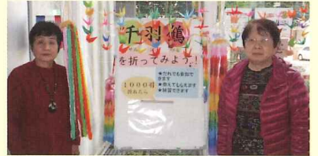
折り紙の文化も伝えます

■仲町台地区センター 大人と子どもがふれあう「場」 子どもと一緒に折り紙で鶴を折り、季節のイベントの飾りを作っています。子ども達を見守りながら心がほっと温まる時間を過ごしてみませんか？ 「つるつと仲町台」毎週水曜日 15:00～17:00 TEL 045-943-9191