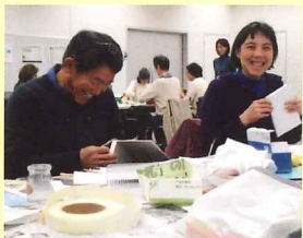
もう一度、手に取ってもらうために！

基礎知識から実習まで学べる初心者向けの講座。定員を超える参加者が集まりました。今後、修理ボランティアとして地域の施設での活躍が期待されます。