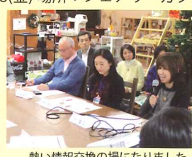
熱い情報交換の場になりました

誰もがふらっと立ち寄れるコミュニティカフェは、地域の居場所になっています。コミュニティカフェがまちづくりの中で果たす役割について、運営している方々と都筑区役所職員が熱くディスカッションしました。