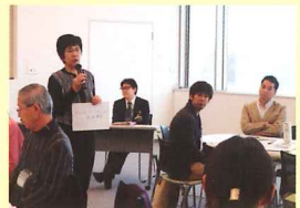
どんなイベントが行われるか楽しみ！

「オリンピック・パラリンピック・英国ホストタウン支援事業について」をテーマに施設同士で連携できそうな事業のアイデアを出し合いました。来年度は、2020年のオリンピック・パラリンピックに向けたイベントが都筑区内のあちこちで開催される予定です。どうぞお楽しみに！