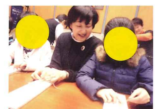
ワークショップ ミサンガ作り(予定)

日時：3/24(土)・25(日) 10:00～16:30(詳細はパンフレットで！) 場所：都筑区役所1階 区民ホール 紙芝居、ガラスアート、室内スポーツなど、子どもから大人まで楽しめるワークショップを行います。