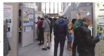
活動を紹介するパネル展示(昨年度の様子)

日時：3/23(金)～3/29(木) 場所：都筑区役所1階 区民ホール 市民活動、生涯学習団体が、活動内容を展示します。