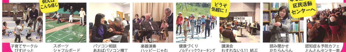
子育てサークル びすけっと

ボランティアな「1日体験」 事前申し込み要 一部有料 日時：3/1(木)～3/29(木) 場所：都筑区内各所