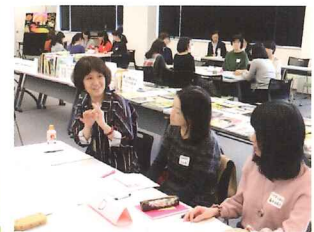
読書好きの都筑区を支えています

つづきっこ読書応援団と都筑図書館共催の「学校図書ボランティア大交流会」に行ってきました。交流会ではグループワークを行い、「読み聞かせ」と「本の修繕」グループに分かれて活発にアイデアを出し合っていました。学校図書ボランティア活動の長い学校から工夫やアドバイスをもらうなど、お互いの情報交換の場