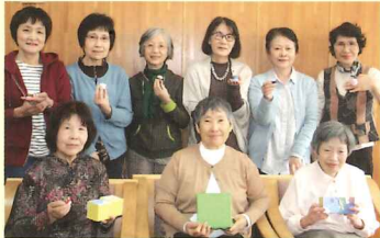
心を込めて作っています

■北山田地区センター シニア女性向けのサロン 赤ちゃんの遊ぶおもちゃ作りや手芸をおしゃべりしながら楽しく行っています。シニア女性が気軽に集まって話せる場です。 「さくらの会」毎月第3火曜日 10:00～11:30 TEL 045-593-8200